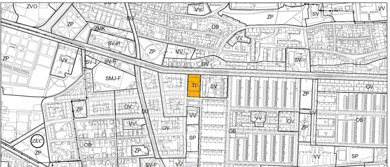
Zákes zadání změny schválený usnesením ZHMP č. 25/26 ze dne 30. 3. 2017